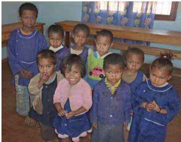
Ecole d'Ambatomanjaka : en attendant des blouses neuves

Environ trois cents blouses sont déjà prêtes pour les enfants des petites classes. Les femmes de l'atelier de couture, installé au collège d'Ambatomanjaka, vont recevoir le renfort du couturier du collège d'Analavory. Il est habitué à confectionner, chaque année, plusieurs centaines de blouses pour les élèves ; c'est donc en professionnel qu'il pourra enseigner les méthodes de couture rapide. Ainsi, nous aurons peut-être suffisamment de blouses neuves pour tous les enfants dès la rentrée prochaine.